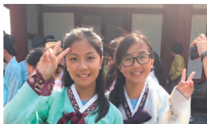
試穿傳統韓國服飾