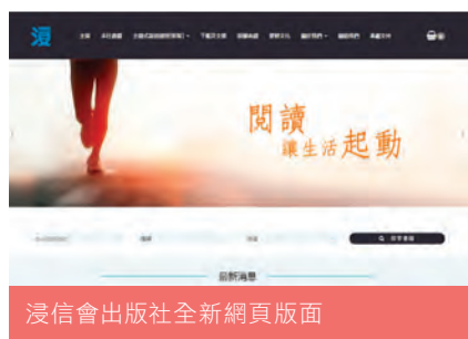
浸信會出版社全新網頁版面