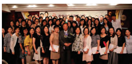
教師團隊以歌聲為陳校監獻上祝福