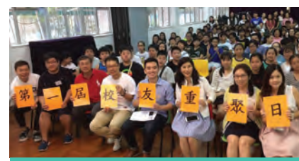
約 150 名校友參與重聚日