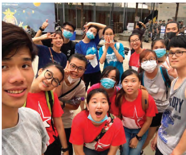
白鴿巢浸信會青年義工隊