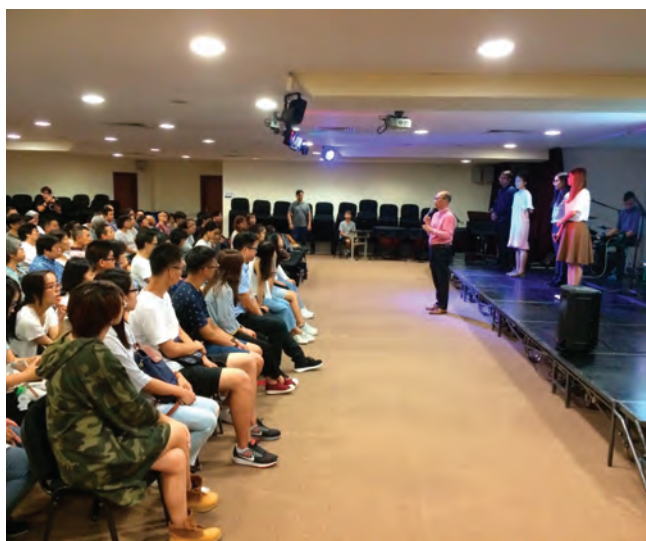
主愛臨濠江動員大會