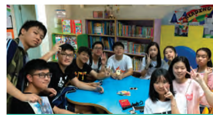
我們很喜歡玩桌上遊戲

活動於當日下午 4 時結束，校友們都帶著滿足的笑臉離開，並期待下次校友會的活動。