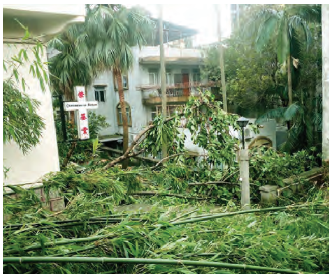
前浸信西差會營舍樹木皆倒