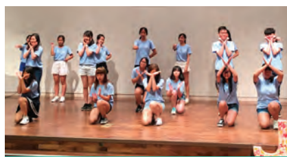
交流生們於閉幕典禮表演 K-POP 舞蹈

九天的行程圓滿結束，對學生來說，這次的交流活動除了可以接觸韓國文化、體驗大學生活外，更珍貴是可以跟不同國家的學生交流，藉此擴闊視野。