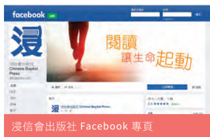
浸信會出版社 Facebook 專頁

有關新產品資訊歡迎瀏覽本社網頁： http://www.bappress.org