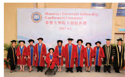
（左起計）浸大校董會司庫陳許多琳女士、賈南溪博士、蔡懿德女士、林海涵博士、李兆麟先生、譚允芝女士、陳守仁博士、鄧貴彰先生、謝吳道潔女士、黃英琦女士、浸大校董會主席鄭恩基先生和浸大校長錢大康教授

九位榮譽大學院士的簡介，可瀏覽網頁： http://hkbuenuews.hkbu.edu.hk/?t=press_release_details/1964