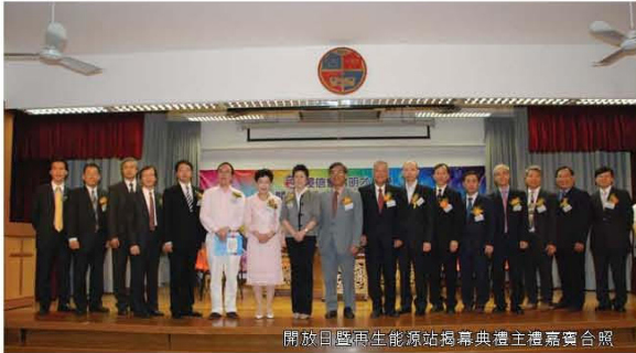
開放日暨再生能源站揭幕典禮主禮嘉賓合照

本校於二零零九年五月十六日(星期六)上午十時至下午四時在本校舉行「開放日暨再生能源站揭幕禮」。目的是透過是次活動讓同學發揮全方位學習精神，並展示學生之學習成果，亦讓外界人士認識本校之再生能源教育及在靈、德、智、體、群、美六育方面的發展。