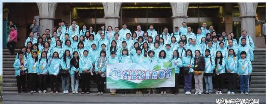
明聲長老會前六合照