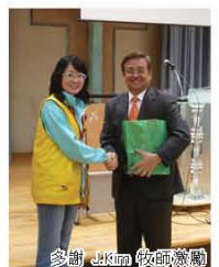
多謝 J.kim 牧師鼓勵