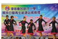
本校拉丁舞組同學表演