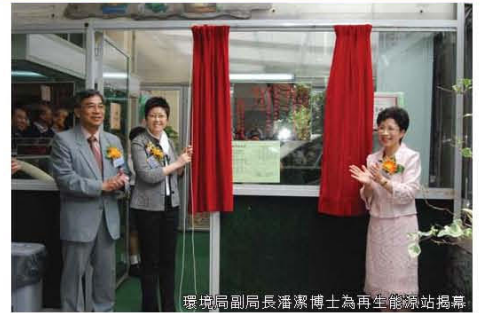
環境局副局長潘潔博士為再生能源站揭幕