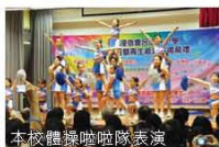
本校體操啦啦隊表演