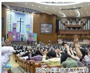
延世中央浸信會萬人崇拜