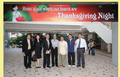
九龍城湖濱浸信會同工蒞臨參與