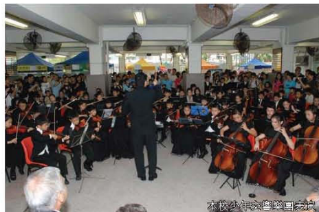
本校少年交響樂團演奏